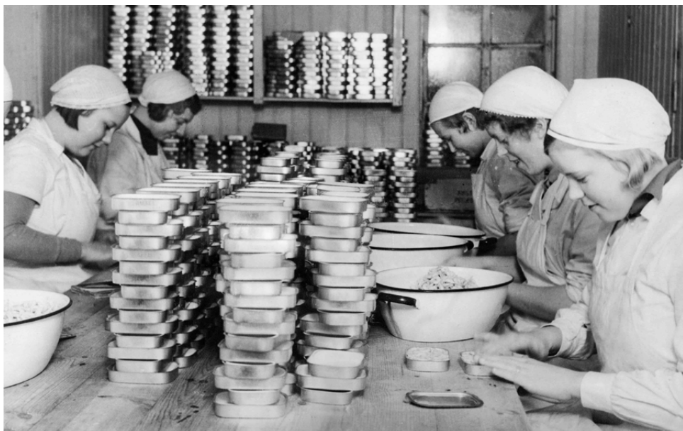
Hällers konservfabrik på 1930-talet.

Sotenäs kommun, det pelagiska fiskets stiftelse och lokala företag har gemensamt påbörjat en första kraftsamling i att se över förut-sättningarna. Låt oss ta vara på möjligheten att bli ett nav för innova-tion och framsteg samtidigt som vår fantastiska livsmiljö bevaras.