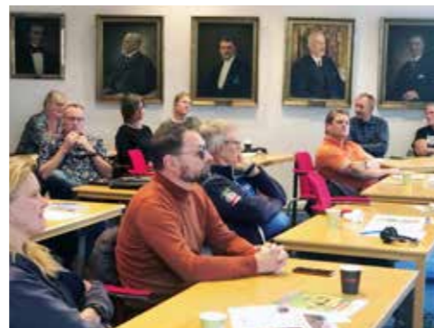
Markägare och besöksnäringens aktörer i Sotenäs